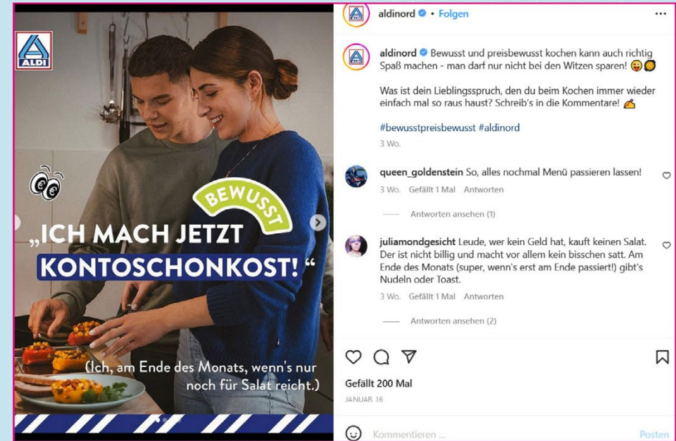
Werbung von Aldi bei Instagram

Und wer denkt, dass es einen Preisunterschied zwischen den Eigenmarken der großen Handelsketten wie Ja! (Rewe), gut&günstig (Edeka), Milbona (Lidl) & Co. gibt, liegt leider falsch. Alle so genannten Preiseinstiegs-Eigenmarken kosten bei den großen Supermärkten in der Regel auf den Cent das Gleiche. Erhöht ein Händler den Preis, kann man sich sicher sein, dass innerhalb weniger Tage die anderen nachziehen. 7