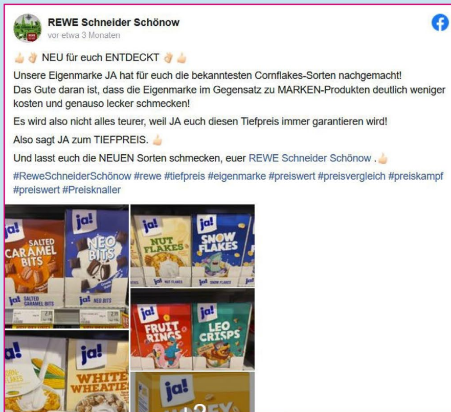
Werbung eines Rewe-Marktes auf Facebook